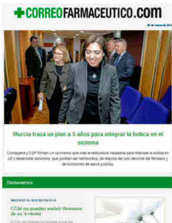
Imagen del nuevo diseño de la nueva newsletter de CF.