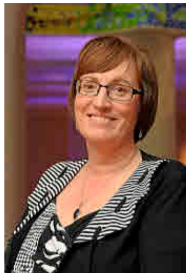
Joan Peppard, presidenta de la EAHP.

Sin embargo, la asunción de liderazgo en todos estos campos de actividad va a requerir una formación que, a día de hoy, todavía no está bien reglamentada en los distintos países de la Unión. Es por eso que uno