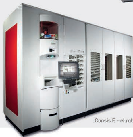
Consis E - el robot con cargador automático

Con los robots CONSIS optimizarás tu gestión de stock preparando tu farmacia para el futuro: