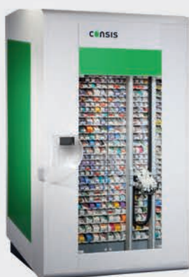
Consis B0 - el robot que ocupa sólo 2 m 2 de superficie