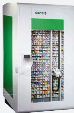
Consis E - el robot con cargador automático